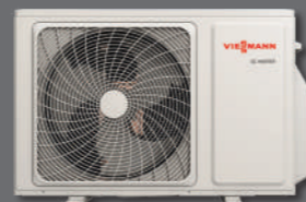
Vitoclima 200-S/HE Black dış ünite