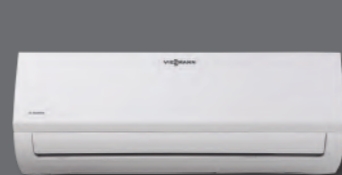
Vitoclima 050-S/HE iç ünite