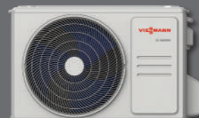
Vitoclima 100-S/HE dış ünite