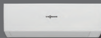
Vitoclima 200-S/HE iç ünite