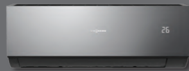
Vitoclima 200-S/HE Black iç ünite