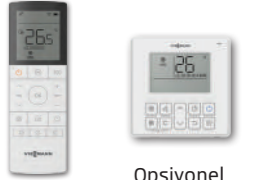
Standart Kablosuz Kumanda