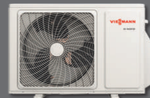
Vitoclima 200-S/HE dış ünite