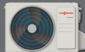
Vitoclima 050-S/HE dış ünite